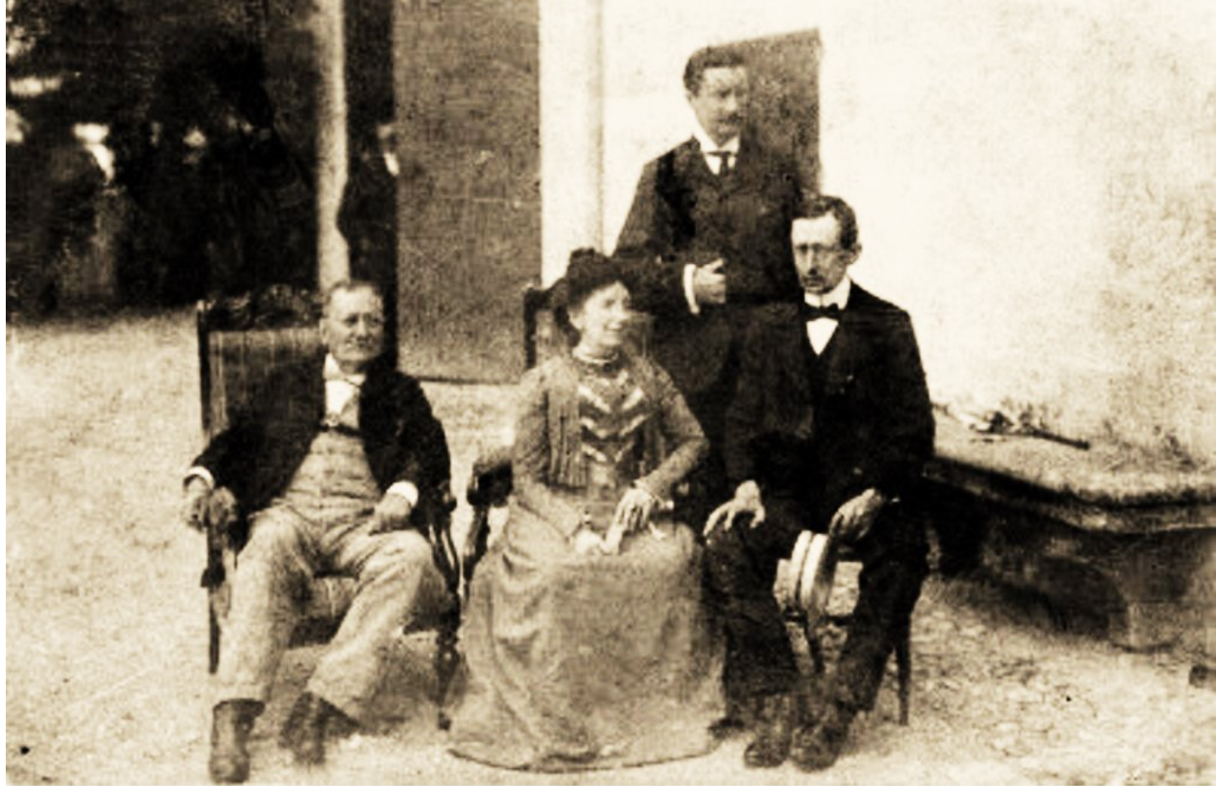
La famiglia Marconi intorno al 1900